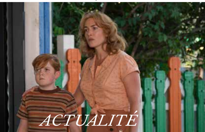
Seule sur la plage la nuit de Hong Sang-soo